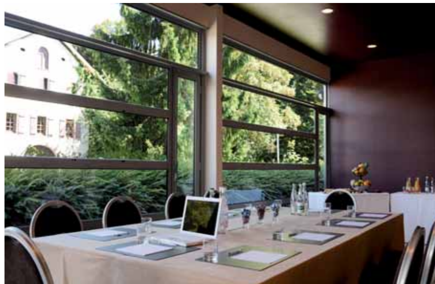
Centre de Convention